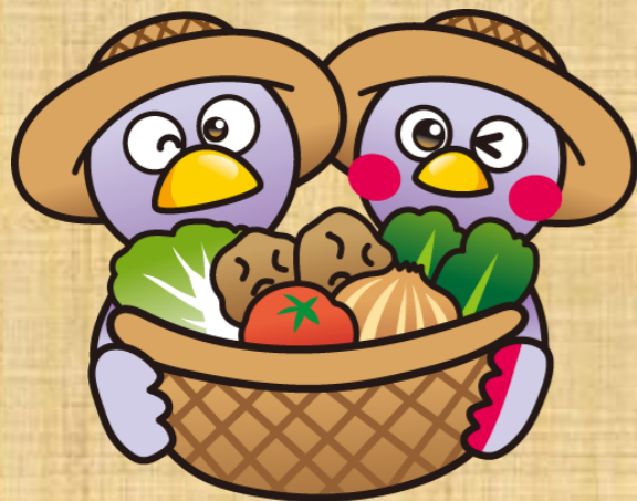
埼玉県マスコット「コバトン」、「さいたまっち」

【問合せ】 埼玉県農林部農産物安全課 安全生産・有機担当 電話：048-830-4057 FAX：048-830-4832 E-MAIL：a4070-08@pref.saitama.lg.jp