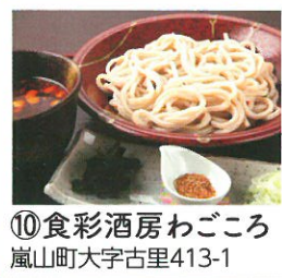
⑩ 食彩酒房わごころ 嵐山町大字古里413-1