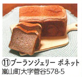
⑪ ブランジェリー ポネット 嵐山町大字菅谷578-5