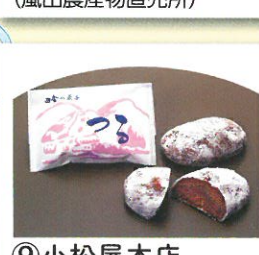
⑨ 小松屋本店 嵐山町大字千手堂686-1 (嵐山農産物直売所)