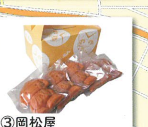
③ 岡松屋 嵐山町大字菅谷390