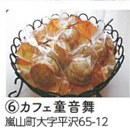
⑥ カフェ童音舞 嵐山町大字平沢65-12