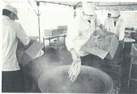
隊員による調理の様子

開催にあたり、官邸より昼食会に『うどん』の要望があり、埼玉県産小麦を使った特色あるうどんを提供したいと入間基地から町にお声がけいただきました。合計80食ほどの注文で、味菜工房で打ったうどんを提供しました。当日は、基地内食堂の大釜でゆでた肉汁うどんが振舞われました。