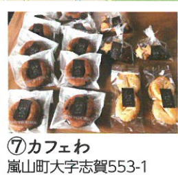
⑦ カフェわ 嵐山町大字志賀553-1