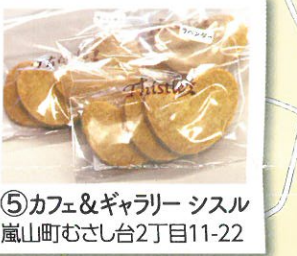
⑤ カフェ&ギャラリー シスル 嵐山町むさし台2丁目11-22