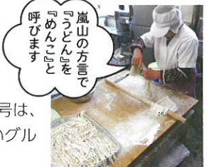
嵐山の方言で「めんこ」と呼びます

「農林61号」は小麦の品種の一つで、うどんや饅頭などに適した、ふっくらもちりとした食感と風味の良さが魅力の中力粉です。栽培効率の良い品種が誕生してきたことで農林61号は埼玉県の奨励品種から外れ、その種子生産が終わりました。それでも、懐かしい味に対するこだわりは根強く、「うどんには農林61号でないと」という声も多くありました。その声に応え、嵐山町でスタートしたのが農林61号復活プロジェクトです。郷土食である「めんこ(うどん)」のみならず、焼き菓子、和菓子、天ぷら粉など様々な使い道があるこの小麦。嵐山町で復活栽培された農林61号は、今日も多くの加工者の手で、美味しいグルメに生まれ変わっています。