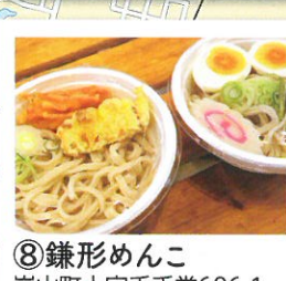
⑧ 鎌形めんこ 嵐山町大字千手堂686-1 (嵐山農産物直売所)