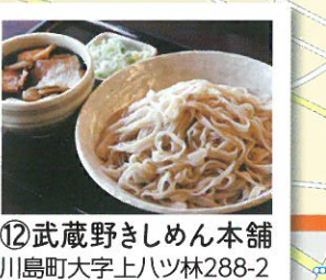
⑫ 武蔵野きしめん本舗 川島町大字上ハツ林288-2