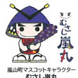
嵐山町マスコットキャラクター むさし嵐丸