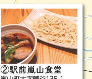
② 駅前嵐山食堂 嵐山町大字菅谷135-1