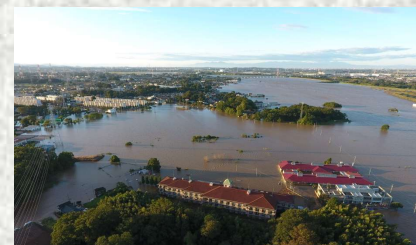
令和元年東日本台風による浸水状況