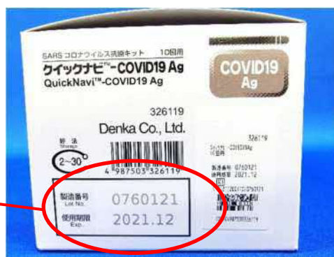
箱の側面に記載されています。