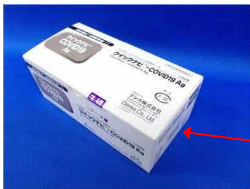
[大塚製薬販売品] 外箱写真