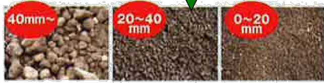
ドラムロッドスクリーンで篩い分け 40 mm〜、20〜40 mm、0〜20 mm