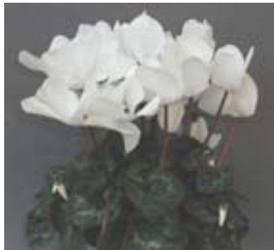
園芸品種( 2n=2x=48 ) Cyclamen persicum