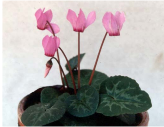
芳香性野生種( 2n=2x=34 ) Cyclamen purpurascens