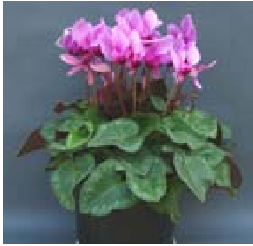
野生種の香りの雑種 種子が採れる 2n=4x=82