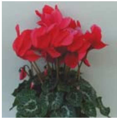
園芸品種( 2n=2x=48 ) Cyclamen persicum