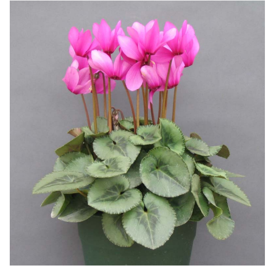
ここのかおり 品種名 : 孤高の香り