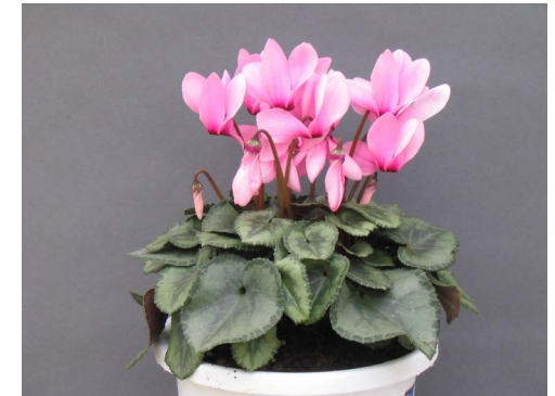
うるわしのかおり 品種名 : 麗しの香り