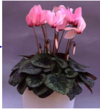
野生種の香りの雑種 種子が採れない 2n=41