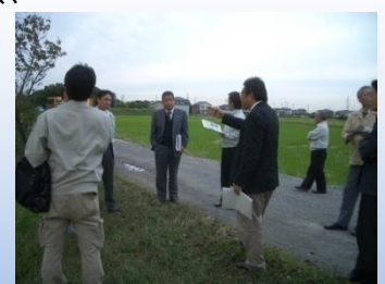
第2回ワークショップ

地域活動 ・地元自治会が樹木管理、草刈りを実施。 ・用水路は葛西用水路土地改良区が管理。