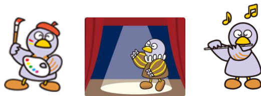
埼玉県マスコット「コバトン」

今までの常識をくつがえすような芸術性、創造性あふれる才能が隠れているかもしれません。