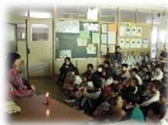
【読み聞かせの様子】