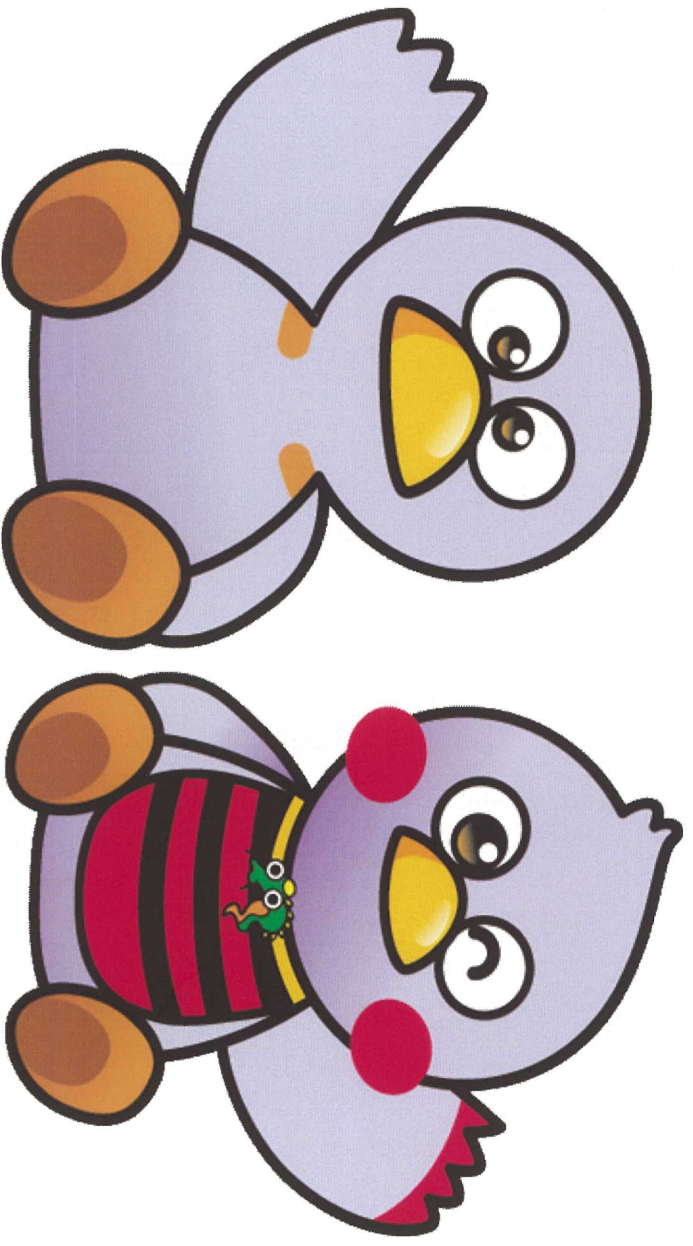
埼玉県ヌスコット 「コバトン&さいたまっち」