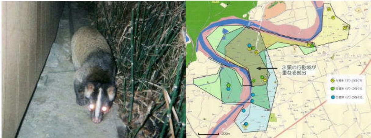
寝屋から出たハクビシン 発信器装着個体の行動域と寝屋

近年、ハクビシンによる農作物被害が多発しています。野生動物の被害対策を効率よく進めるためには生活や行動パターンを知ることが重要です。中山間営農担当では、発信器を利用した調査や飼育個体による行動調査を実施しその生活を明らかにしました。その結果から収穫残や生ゴミなどエサとなるものの撤去や寝屋となっている建物に入れない対策をすることで被害が減少することがわかりました。また、農作物を守る技術として、登らせて感電させる電気柵「白落くん」を開発しました。「白落くん」は乾電池式のパワーユニットを使用するので安価で簡単にどこでも設置できる効果の高い電気柵です。