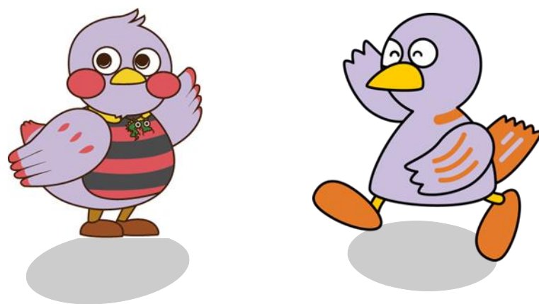
埼玉県マスコット 「さいたまっち」「コバトン」