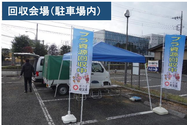
回収会場（駐車場内）