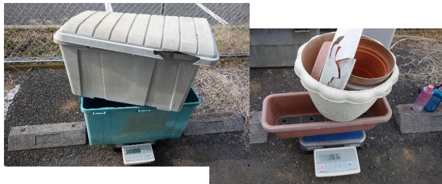
屋外利用のものは劣化したものが多かった