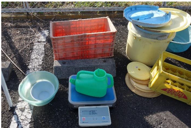
桶、じょうろ、洗面器等

桶17、小物ケース11、苗トレイ8、洗面器・風呂いす8、洗剤等ボトル5、 シャンプー等ボトル4、じょうろ2、たらい2、コンポスト容器2、おもちゃ2、その他7