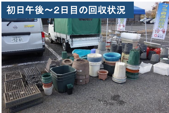
初日午後～2日目の回収状況