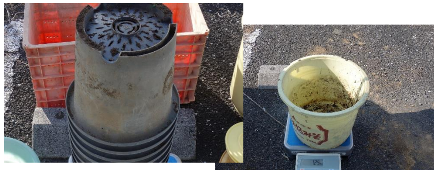
汚れ等の付着状況(土等)