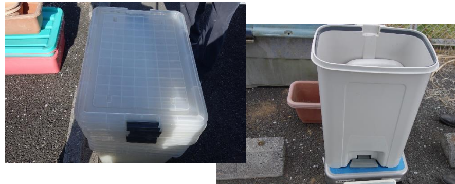
屋内利用のものはまだ使えるものも多かった