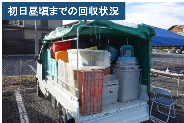
初日昼頃までの回収状況