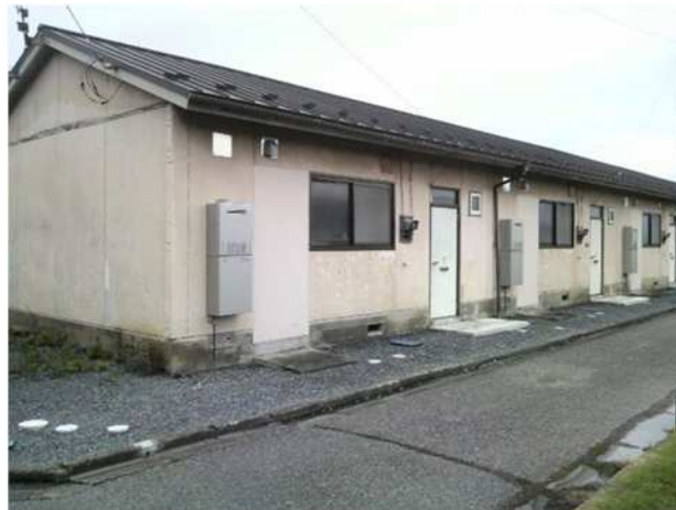
本庄市営四方田住宅