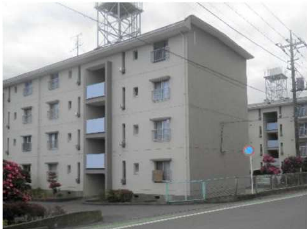
飯能市営富士見住宅