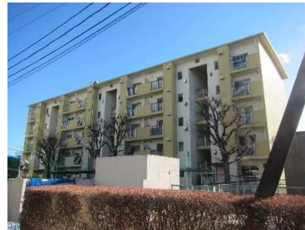
蕨市営錦町2丁目第1住宅