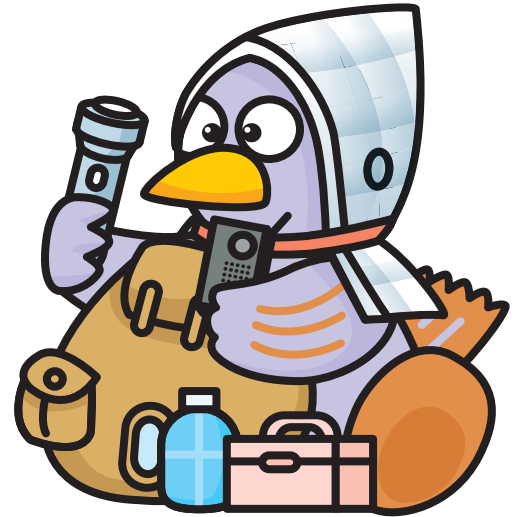
埼玉県マスコット コバトン