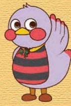
埼玉県マスコット「さいたまっち」