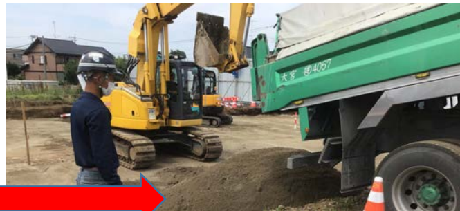
~20 mm調質改良土を埋戻し材として利用