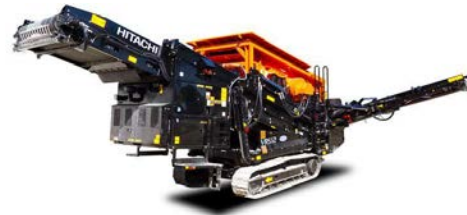
用途に応じて篩い分け