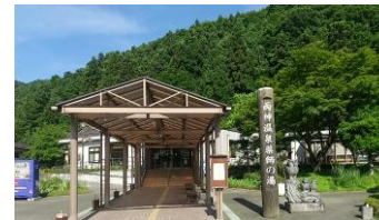
両神温泉薬師の湯