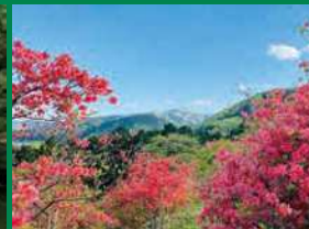
身近な緑の部 優良賞「天空のつづじ」(寄居町)