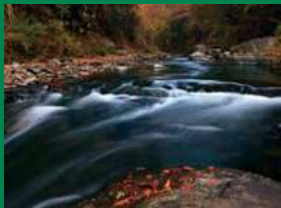
トラスト保全地の部 佳作「秋色の渓谷」(トラスト3号地)