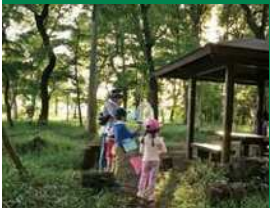
トラスト保全地の部 優良賞「森への窓口」(トラスト12号地)