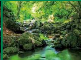
身近な緑の部 最優秀賞「新緑の清流」(寄居町)