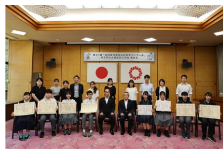
■令和7年度表彰式の様子