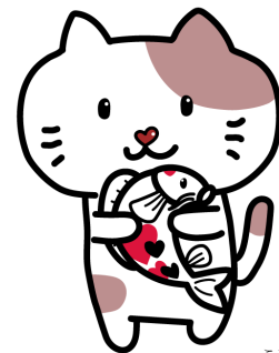
（抱えているのは、師匠の鯉 こい せんせい）