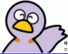
埼玉県マスコット コバトン&さいたまっち