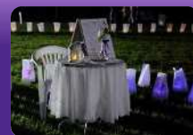
会場を優しくつつむルミナリエ