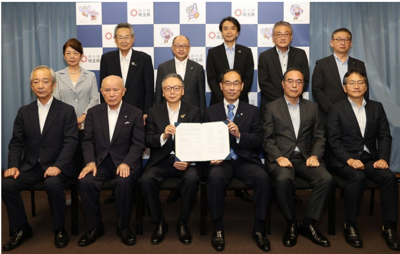
▲「価格転嫁の円滑化に関する協定」締結の様子 (令和4年9月8日)