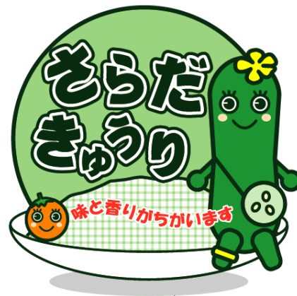
図4 いぼなしキュウリロゴマーク