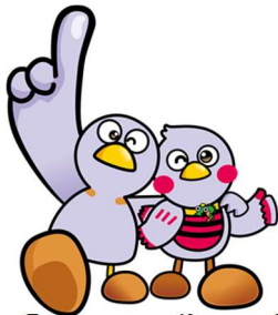
โคบาตง ไซตามัจจิ

โดยจะออกงานแนะนำจังหวัดไซตามะร่วมกับโคบาตงเสมอ