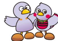
埼玉県マスコット 「コバトン」 & 「さいたまっち」