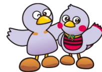
埼玉県マスコット 「コバトン」&「さいたまっち」