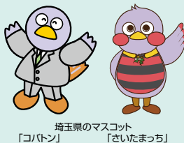
埼玉県のマスコット 「コバトン」 「さいたまっち」

※祝日、年末年始(12/29～1/3)を除く。 ※就職相談とセミナーは原則予約制です。 紹介状の発行やハローワーク求人情報の検索は月～金のみとなります。 ※雇用保険の手続きは行っておりません。