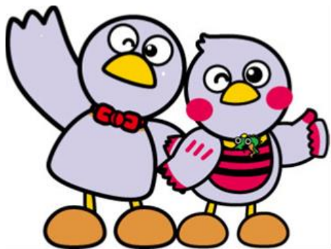
埼玉県マスコット 「コバトン」 & 「さいたまっち」