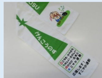
市のインセンティブ付