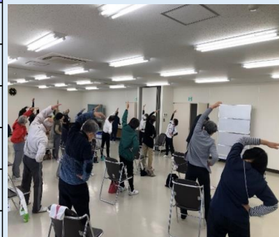
健幸フォローアップ教