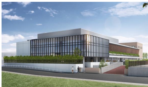
朝霞児童相談所（仮称）外観イメージ

県熊谷児童相談所の整備に続き、朝霞市内に県南西部地域を管轄する県8番目となる児童相談所として、令和7年度の開所を目指し、令和5年度から建設工事に着手します。