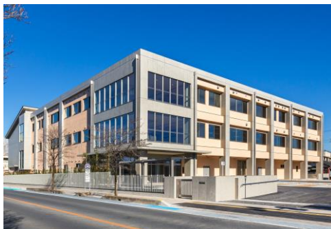
熊谷児童相談所 新庁舎外観

このたび、県北部地域の一層の体制強化を図るため、老朽化、職員の増員により事務室が手狭になっていた県熊谷児童相談所の庁舎の建替えに合わせ、県北部地域初となる一時保護所を一体的に整備し、令和5年3月13日より新庁舎で業務を開始しました。