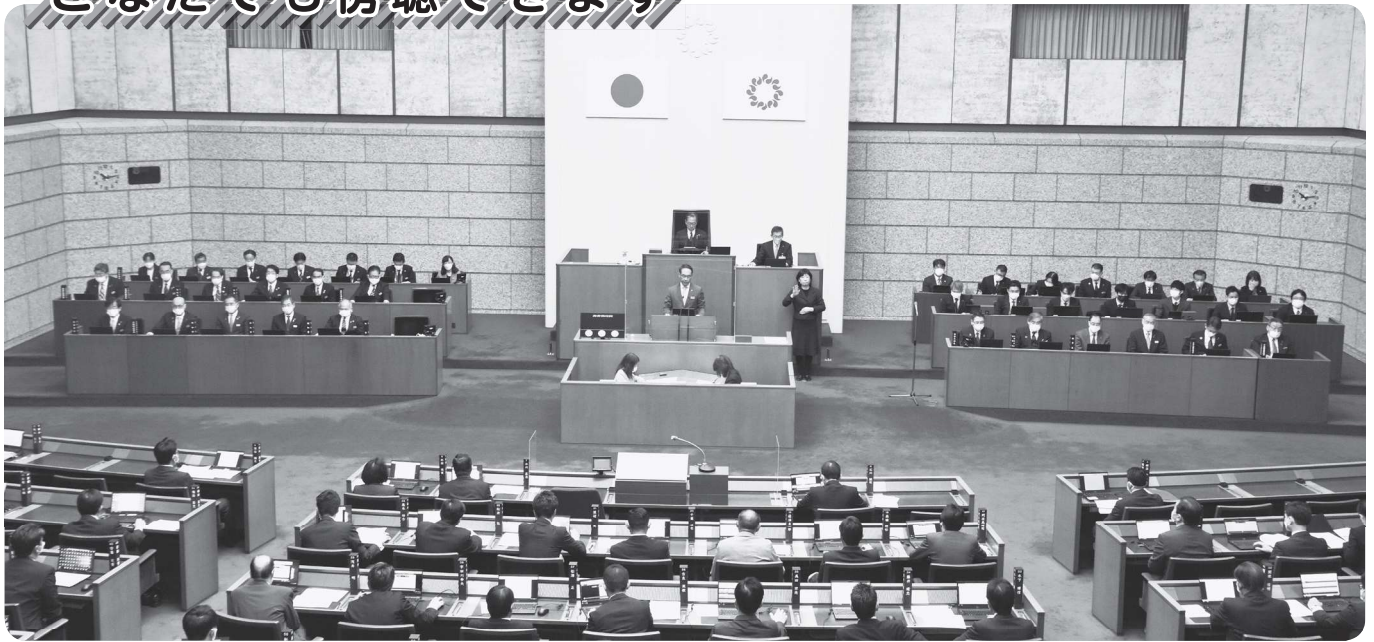
本会議場（令和4年12月定例会）

県議会の本会議は、県議会議事堂4階の傍聴者受付で手続きをしていただければ傍聴ができます。本会議の傍聴席は216席です。また、委員会も受付で手続きをしていただければ傍聴ができます。ご用意している傍聴席は、各委員会とも20席です。本会議、委員会ともに車いすのままでも傍聴ができます。