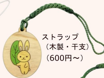
ストラップ (木製・干支) (600円～)