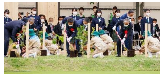
令和4年 第72回全国植樹祭（滋賀県）