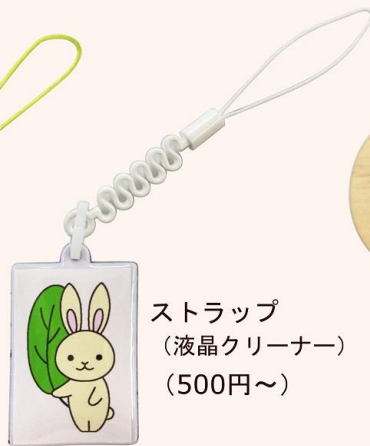
ストラップ (液晶クリーナー) (500円～)