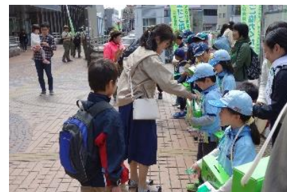
前回の街頭募金の様子（大宮駅）