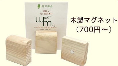
木製マグネット (700円～)