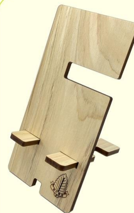
木製スマホスタンド (1,000円～)