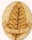
バッジ (木製・丸) (600円～)