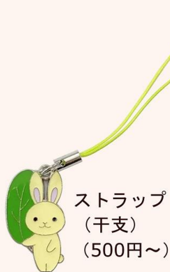
ストラップ (干支) (500円～)