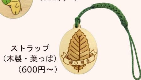
ストラップ (木製・葉っぱ) (600円～)