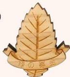
バッジ (木製・葉っぱ) (600円～)