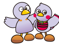
埼玉県マスコット 「コバトン」&「さいたまっち」