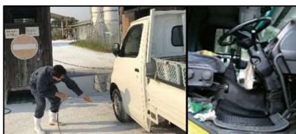
車両はタイヤだけでなく、 泥よけの内側まで消毒 し、 フロアマットの交換やペダル等車内も消毒