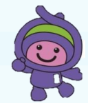
上尾市マスコット 「アッピー」