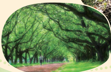
身近な緑の部 最優秀賞「新緑トレーニング」(川越市)

第23回 トラスト保全地の部 最優秀賞「ドングリ見〜つけ!!」 (トラスト10号地)