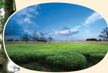
トラスト保全地の部 優良賞「浮野の里」(トラスト10号地)

応募は郵送とInstagram 「#緑のトラストフォト2023」 で応募できます。