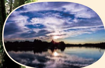
トラスト保全地の部 優秀賞「黒浜沼の夕景」(トラスト11号地)