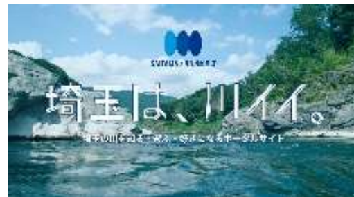
リバサポ・ポータルサイト