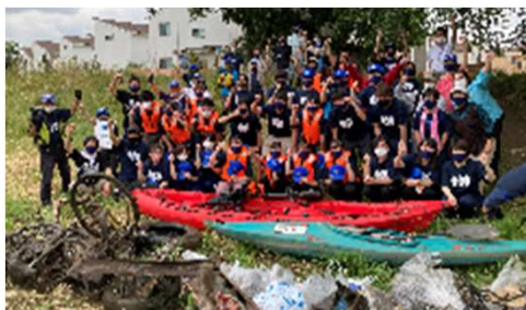
カヌーでの清掃活動

川の再生活動に必要な資材の提供や貸出、団体相互の交流と活動成果の共有を図る「川の再生交流会」の開催