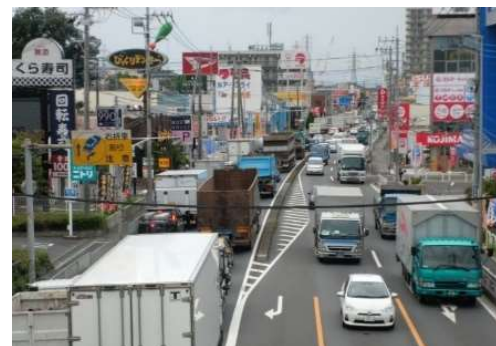
現道の渋滞状況 国道254号(新座市内)