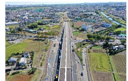
整備状況 国道254号(和光富士見バイパス)