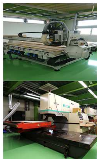
ミーリング加工機