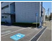
上里町役場EV充電スタンド