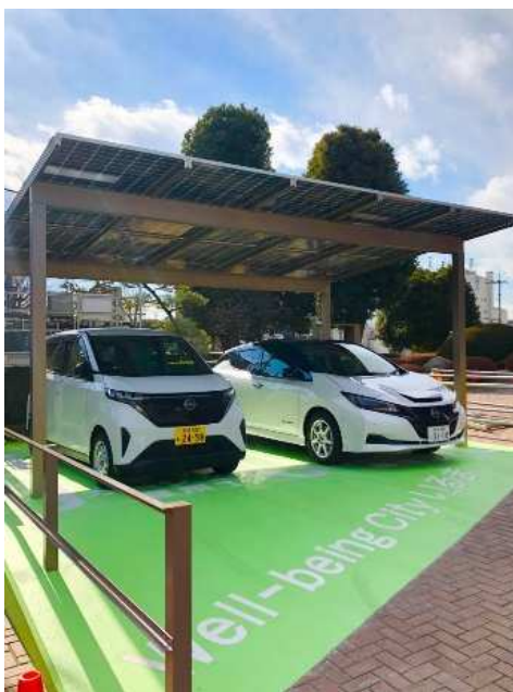
EVステーションの様子

我が国では、2050年ゼロカーボンの実現とともに、2030年度の温室効果ガス排出量を 2013年度比で46%削減 する目標の実現に向け、EVを通じた再生可能エネルギーの活用を行うとともに、 EVのシェアリング により、市民へ脱炭素や地球温暖化防止といった環境への啓発及びEVの普及促進を図ることを目的としています。