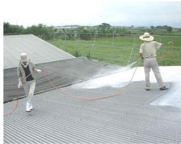
石灰の吹き付け（宮崎県）