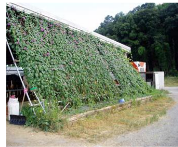
ネットに植物を這わせる（兵庫県）