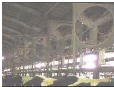
換気扇による送風（福井県）