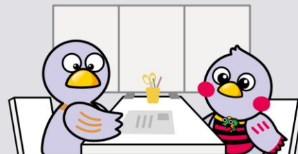
埼玉県マスコット「コバトン＆さいたまっち」