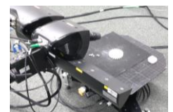
3Dデジタルサイネージ