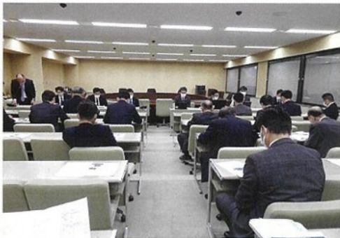
条例改正案を議論するプロジェクト・チームの様子

条例が早期に制定され、障害者等が利用しやすい環境づくりが整うよう、皆様のご意見を宜しくお願い致します。