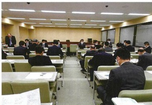
条例改正案を議論するプロジェクト・チームの様子

条例が早期に制定され、障害者等が利用しやすい環境づくりが整うよう、皆様のご意見を宜しくお願い致します。