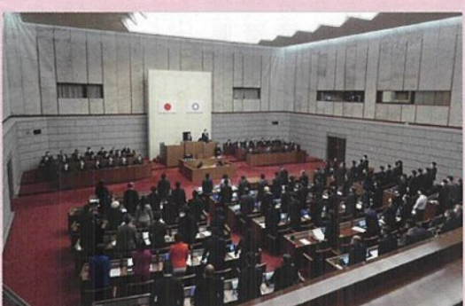
全会一致にて条例を採択した埼玉県議会

昨年二月定例会に於いて、「埼玉県ひきこもり支援に関する条例」を自民党発議で提案致しました。条例の内容は、ひきこもり状態にある者の意思を尊重することを基本理念として定め、県の責務及び民間支援団体等の役割を明らかにするとともに、民間支援団体等による支援を推進するために必要な事項を定めることにより、安心して支援を受けられる社会を実現することを目的とするものであります。条例は、全会派一致にて可決・成立。