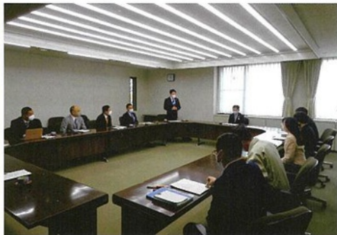
久喜市にて制度等の視察を行うPT幹部

自由民主党埼玉支部連合会ホームページ www.jimin-saitama.net