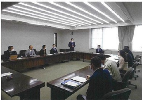
久喜市にて制度等の視察を行うPT幹部

自由民主党埼玉県支部連合会ホームページ www.jimin-saitama.net