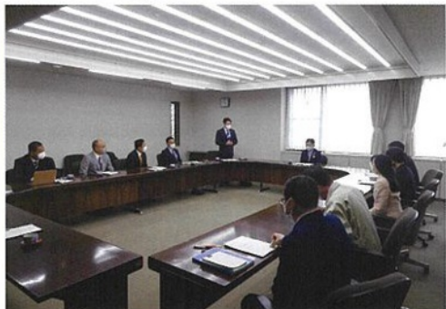
久喜市にて制度等の視察を行うPT幹部

自由民主党埼玉県支部連合会ホームページ www.jimin-saitama.net