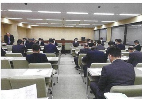
条例改正案を議論するプロジェクト・チームの様子

条例が早期に制定され、障害者等が利用しやすい環境づくりが整うよう、皆様のご意見を宜しくお願い致します。