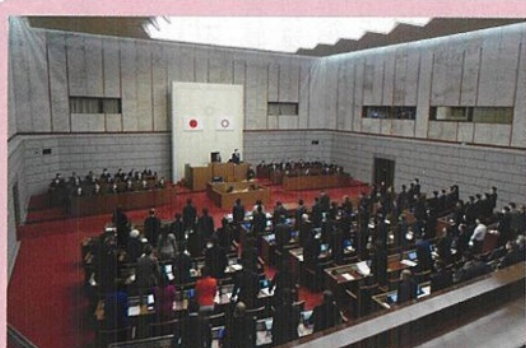
全会一致にて条例を採択した埼玉県議会

「ひきこもり」はさまざまな要因によって社会的な参加の場がせげばまり、就労や就学などの自宅以外での生活の場が長期にわたって失われている状態のことを指します。埼玉県議会自由民主党議員団では、ひきこもり支援に関するプロジェクトチームを作り、ひきこもり支援のための協議を続けて参りました。昨年二月定例会に於いて、「埼玉県ひきこもり支援に関する条例」を自民党発議で提案致しました。条例の内容は、ひきこもり状態にある者の意思を尊重することを基本理念として定め、県の責務及び民間支援団体等の役割を明らかにするとともに、民間支援団体等による支援を推進するために必要な事項を定めることにより、安心して支援を受けられる社会を実現することを目的とするものであります。条例は、全会派一致にて可決・成立。