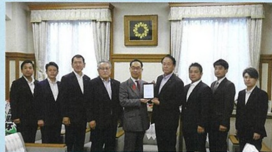
大野知事に政策大綱を提言する自民党県議団役員

知事からは、予算編成に際しては各部署に周知を図り、ご提案の反映に向けた検討をさせて頂きたいと前向きな返答がありました。