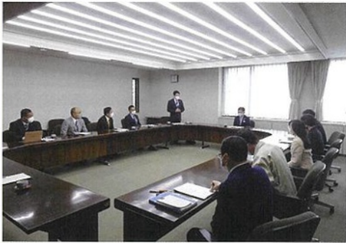
久喜市にて制度等の視察を行うPT幹部

自由民主党埼玉支部連合会ホームページ www.jimin-saitama.net