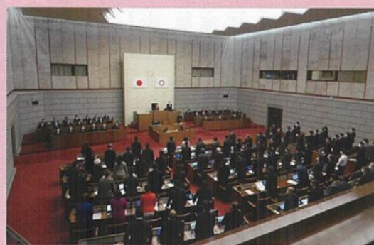
全会一致にて条例を採択した埼玉県議会

「ひきこもり」はさまざまな要因によって社会的な参加の場面がせぼまり、就労や就学などの自宅以外の生活の場が長期にわたって失われている状態のことを指します。埼玉県議会自由民主党議員団では、ひきこもり支援に関するプロジェクトチームを作り、ひきこもり支援のための協議を続けて参りました。昨年二月定例会に於いて、「埼玉県ひきこもり支援に関する条例」を自民党発議で提案致しました。条例の内容は、ひきこもり状態にある者の意思を尊重することを基本理念として定め、県の責務及び民間支援団体等の役割を明らかにするとともに、民間支援団体等による支援を推進するために必要な事項を定めることにより、安心して支援を受けられる社会を実現することを目的とするものであります。条例は、全会派一致にて可決・成立。