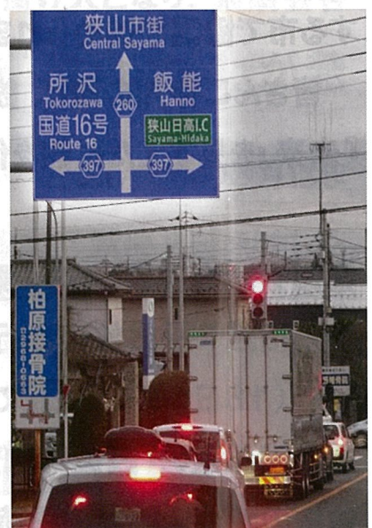
柏原小入口 交差点

狭山市は工業で発展して来た街。ご不便をお掛けしますが、混雑緩和・安全対策に向け、市民の皆様のご理解とご協力をよろしくお願い致します。