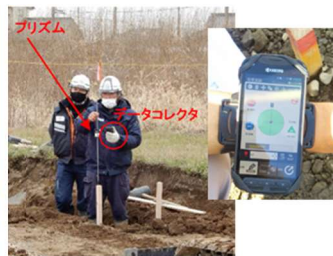
小構造物工でのICT活用