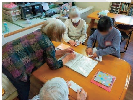
高齢者施設でのこどもの居場所づくり

共に支え合う社会づくりのため、地域における先駆的・モデル的な福祉活動を行うNPO法人等を支援します。