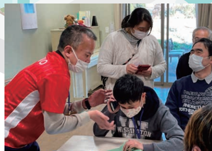
視覚障害の方が運営に関わる 「スマホタブレット教室」