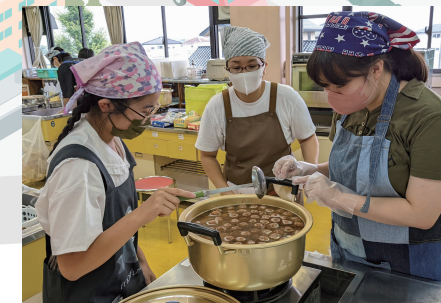
こども食堂での食事づくり体験