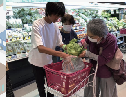
高齢者の買い物のお手伝い体験 (地域住民の支え合い活動)

ボランティア活動の普及、啓発、育成を図るため、気軽に体験できるボランティア体験学習を支援します。