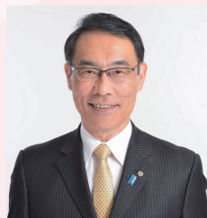
埼玉県知事 大野元裕

県民の皆様とともに「日本一暮らしやすい埼玉県」を実現するため、これからも一層の御支援、御協力を賜りますようお願い申し上げます。