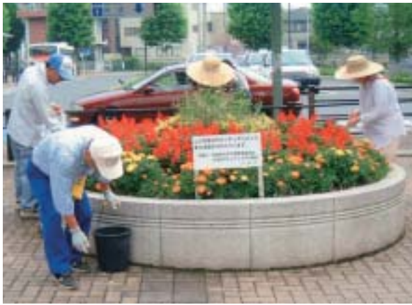
▲久喜市駅前東口花壇の花がら摘みやゴミ拾いなどの美化運動

一般家庭の庭・玄関周りや、学校の花壇を写真に撮り応募していただく「ガーデニングス久喜」を開催しています。本年は208件の参加がありました。 また、花の講習会等を開催し、花と緑あふれる街づくりに努めています。