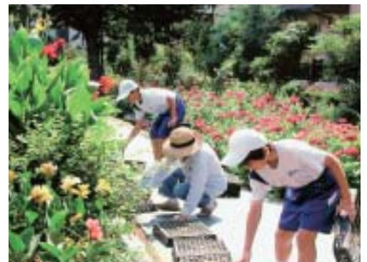
▲夏休みになると、中学生がボランティアに来てくれます