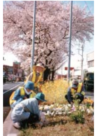
▲春は菜の花から桜とパンジーが主役に

当初は山となっていた多様なゴミを拾うことから始まりました。次いで、ここを街の顔として草花の植栽による花園化を目指し、月3～4回、ゴミ拾いと季節の花植え、手入れ作業を行うようになりました。灯灯無尽、美化運動の輪が広がることを念願しています。