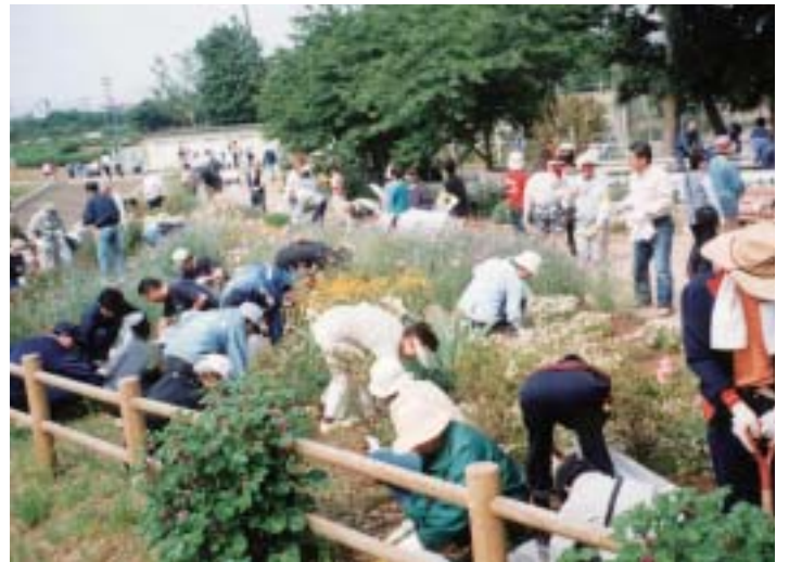
▲クリーン作戦でとしたり公園の除草に汗を流す