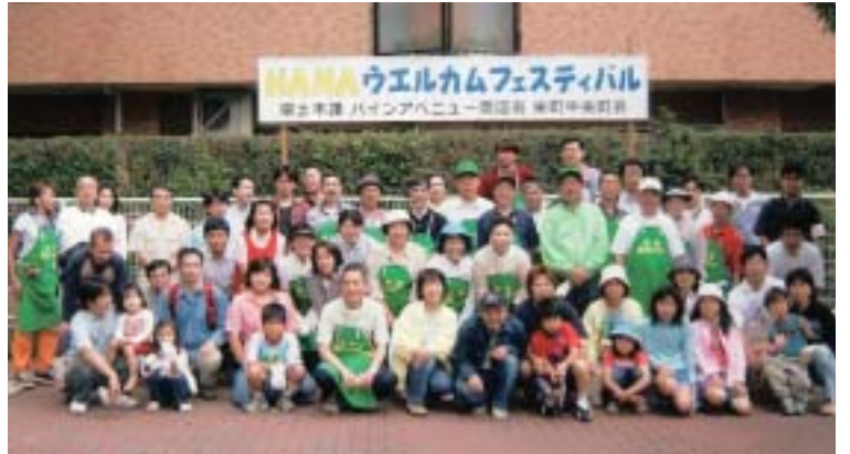
▲親子で楽しむ花植えイベント「HANA ウェルカムフェスタ」参加者たち 毎回大勢の方が参加されます

「きれいな町に犯罪はない」を合言葉に、町内どこの通りにも四季折々の花を咲かそうと始めた、クラブ員による町内環境美化活動も少しずつ軌道に乗り、今では春のチューリップ、初夏のあじさい、真夏のサルビア、秋のパンジー、冬のサザンカが通りに彩りを添えています。