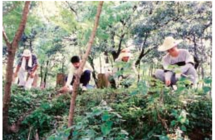
▲地道な作業もたくさんあります