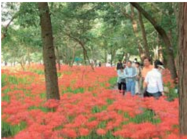
▲曼珠沙華が真っ赤な絨毯のようです