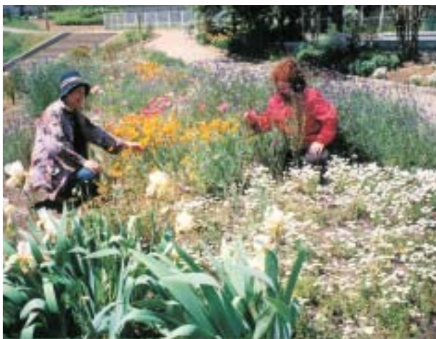
▲散歩中の方も思わず花に歩みを止めます